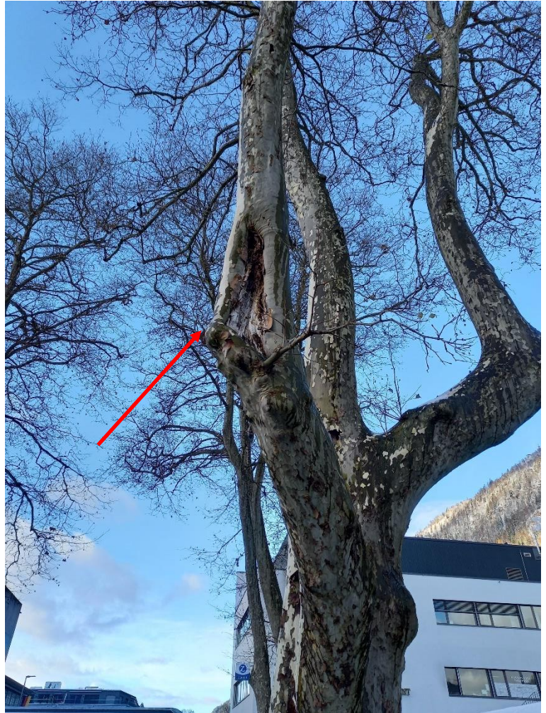
Baum Nr. 2, Anfahrschaden

Bei diesem Baum hat ein Starkast eine grössere oberflächige mechanische Verletzung. Wir vermuten, dass es sich hier um einen Anfahrschaden handeln könnte. Diese Verletzung macht den betreffenden Starkast instabil und Ausbruch gefährdet. Diese Schwachstelle wurde bereits mit einer eingebauten dynamischen Kronensicherung entschärft. Die Bruchsicherheit kann momentan gewährleistet werden. Eine regelmässige Kontrolle der Kronensicherung alle zwei Jahre ist notwendig.