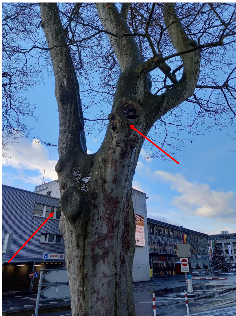
Baum Nr. 1, Astungswunden

Vor etlichen Jahren wurden an dieser Platane, um das Lichtraumprofil zu erreichen, zwei grössere Astabnahmen ausgeführt. Die Astabnahmen haben bis zu 35 cm Durchmesser. Auf dem Bild sieht man, dass die untere Astungswunde bereits komplett abgeschottet ist. Bei der oberen Astungswunde ist die Abschottung auch schon ausgeprägt vorhanden. Ein grösserer Fäulnisherd ist hinter der oberen Astungswunde nicht zu erwarten. Die mechanische Beeinträchtigung ist gering. Der sichtbare Pilz auf der oberen Astungswunde befällt Totholz und stellt kein Problem dar. Die betroffenen Kronenabschnitte sind aus Sicht der Stand- und Bruchsicherheit nicht problematisch.